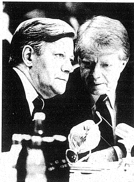
El Presidente Carter (derecha) y el Canciller de Alemania Occidental

Jimmy Carter, Mensaje a la Reunión Trilateral de Tokio, Enero de 1977.